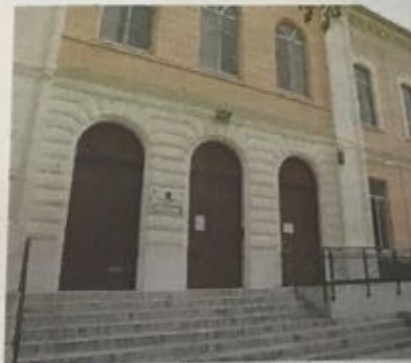
BARLETTA La scuola elementare «D'Azeglio»

● BARLETTA. Svolta nell'edilizia scolastica cittadina nell'ottica di intervenire decisamente nell'opera di adeguamento e ristrutturazione in termini di fruibilità e sicurezza. Così vanno inquadrati i provvedimenti a favore degli edifici scolastici «Massimo D'Azeglio» e «Maria Montessori».